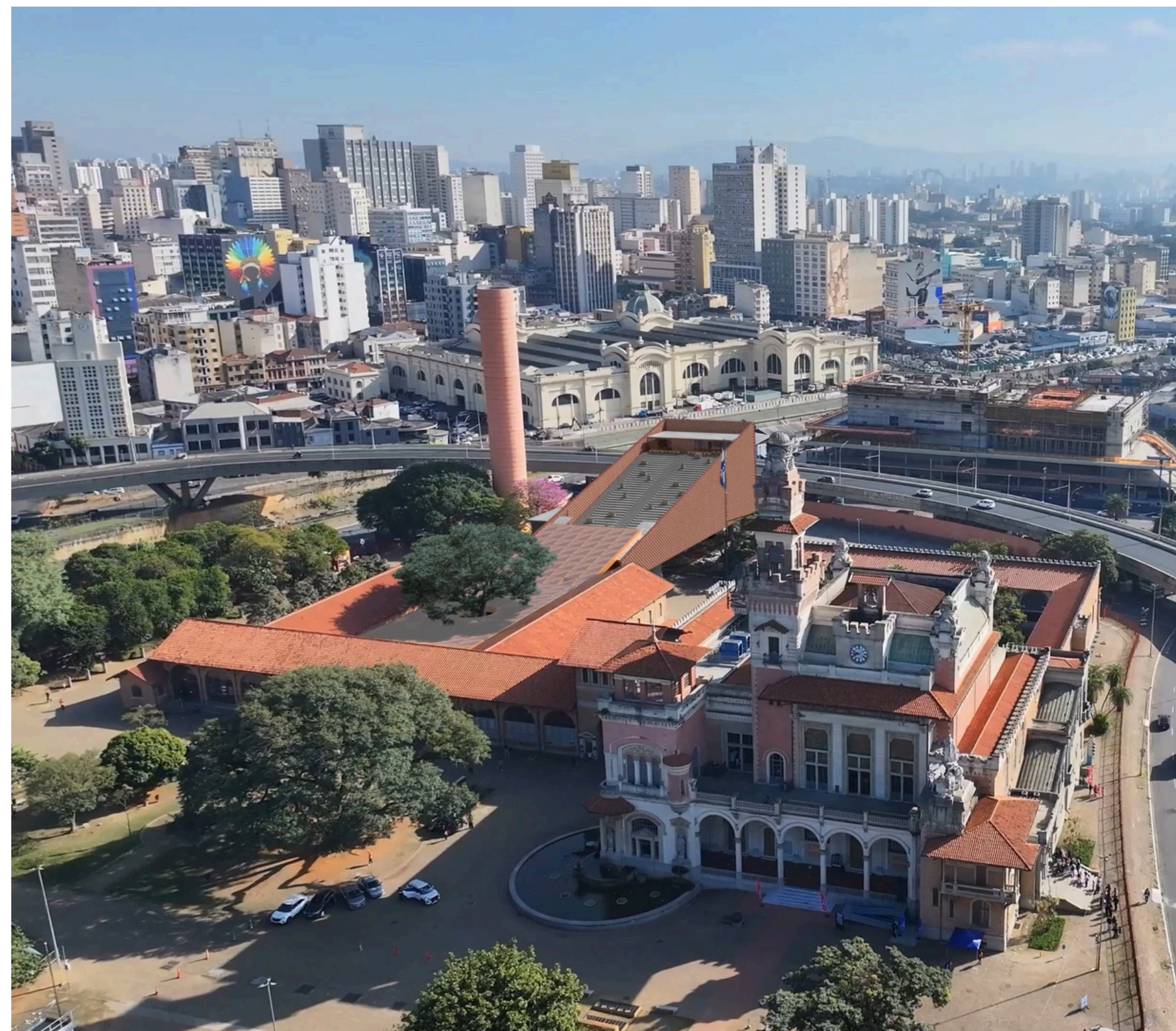
*Imagem meramente ilustrativa; projeto em desenvolvimento.

Em 2024, recebeu mais de 800 mil pessoas;