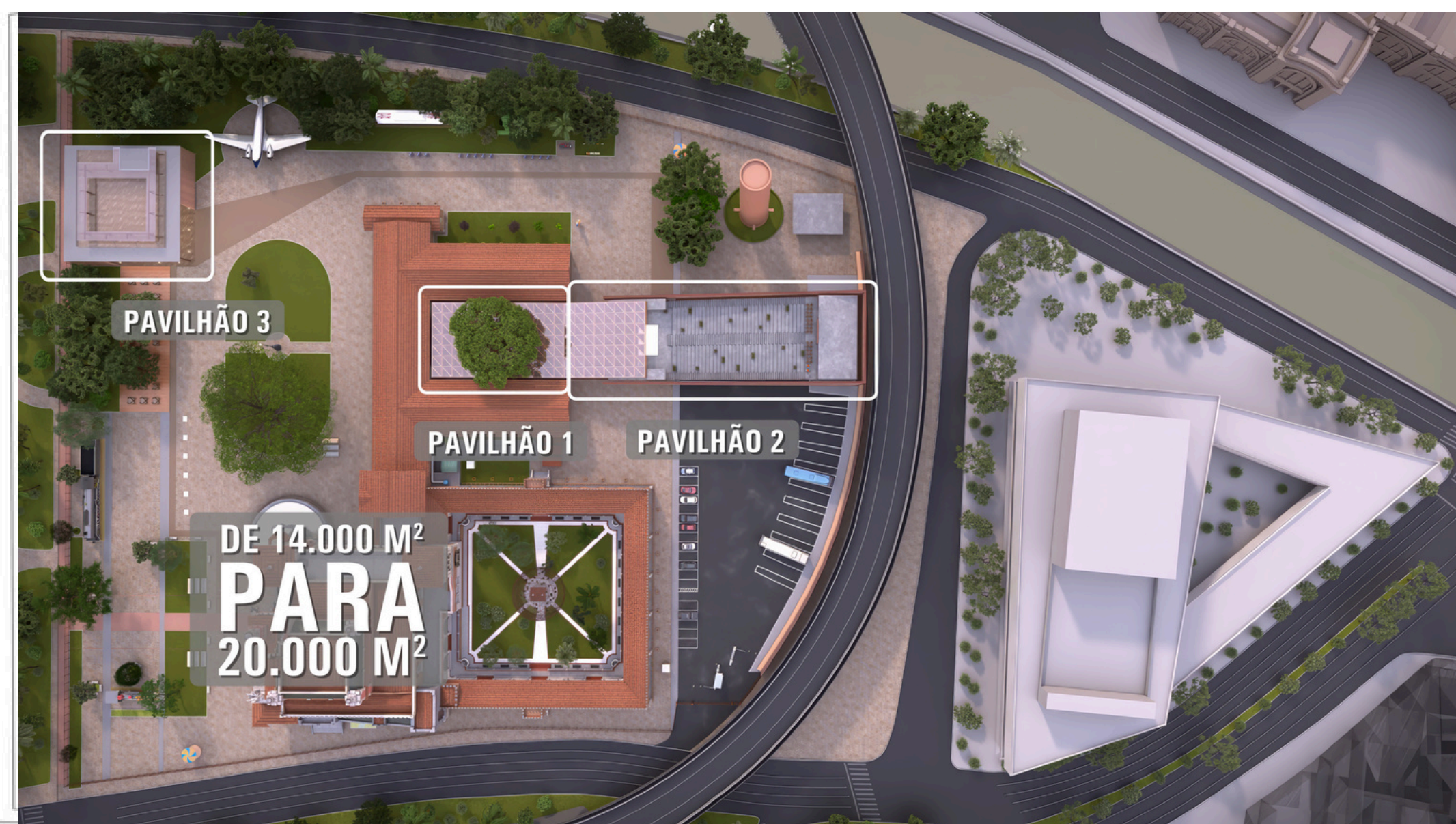
Os novos pavilhões do Museu Catavento