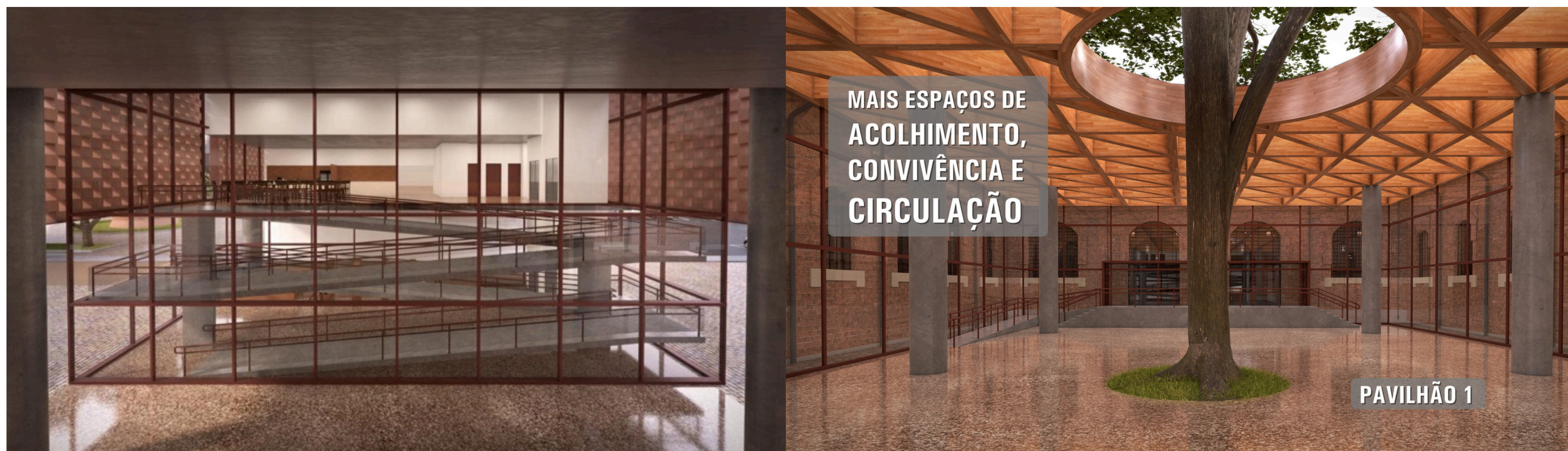
Circulação vertical para o Pavilhão 2

Também será possível a circulação vertical para o Pavilhão 02, com acesso às exposições temporárias.