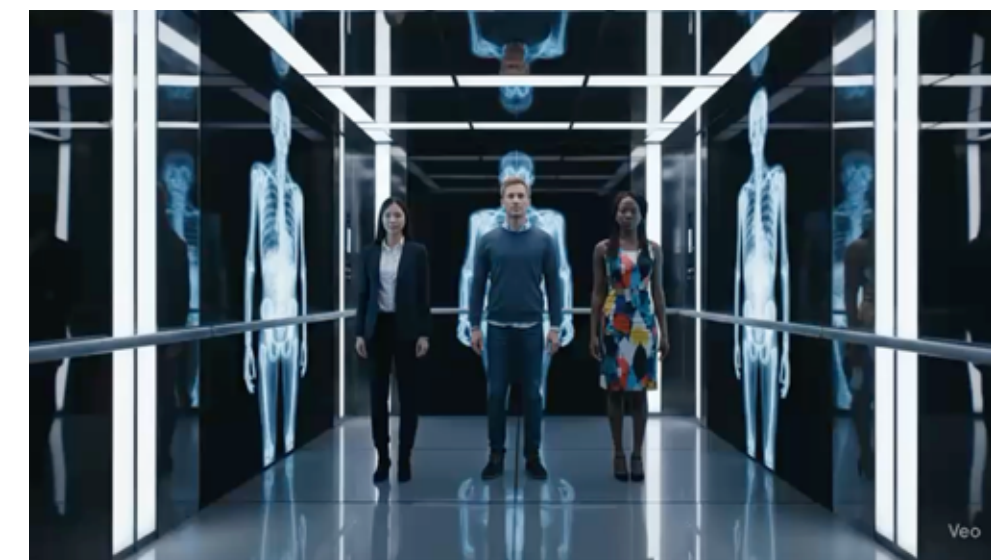
Elevador do DNA