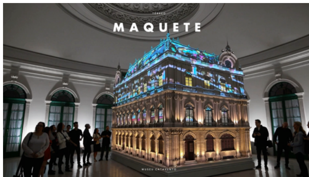
Maquete do Palácio das Indústrias

Toda a narrativa expositiva do Museu Catavento será renovada: