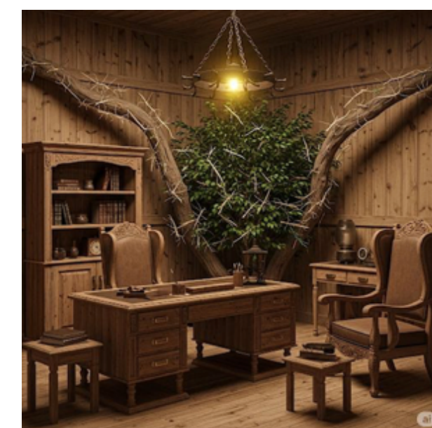
Gabinete do Bicho Pau