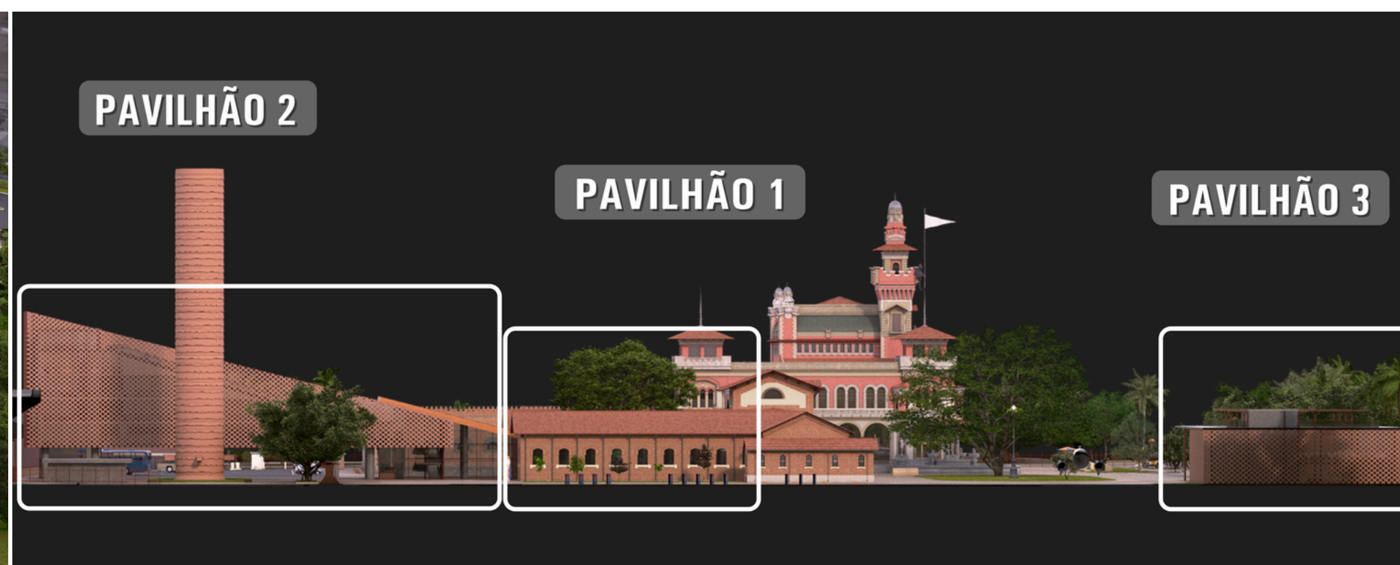
Corte com os novos pavilhões