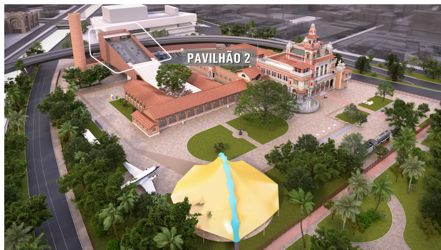
Vista do novo Pavilhão 2

Sua implantação atende a uma necessidade estratégica do Museu Catavento: ampliar significativamente a capacidade de receber projetos expositivos de alta complexidade, incluindo objetos de grandes dimensões e instalações tecnológicas de última geração.