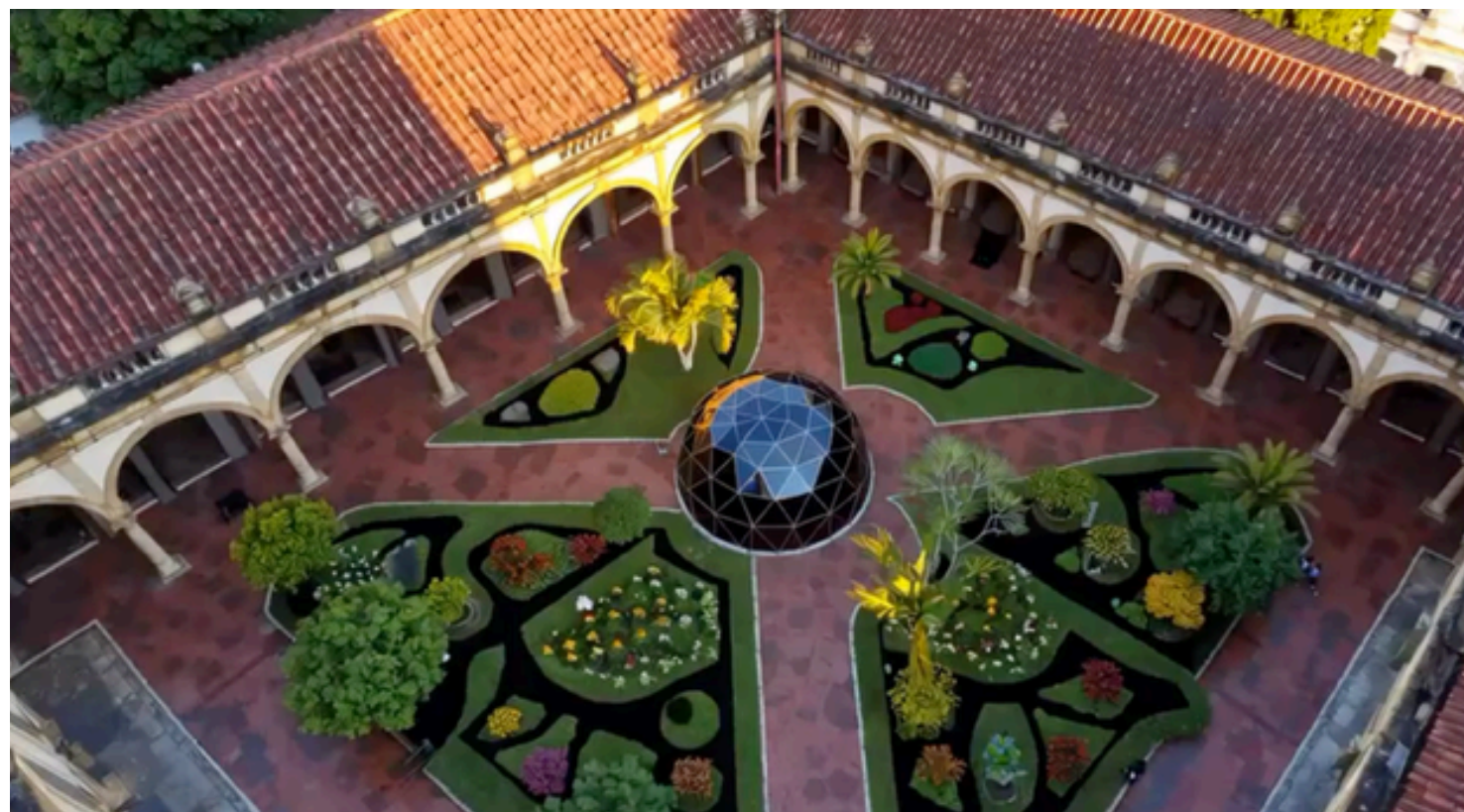
Biomass do Brasil