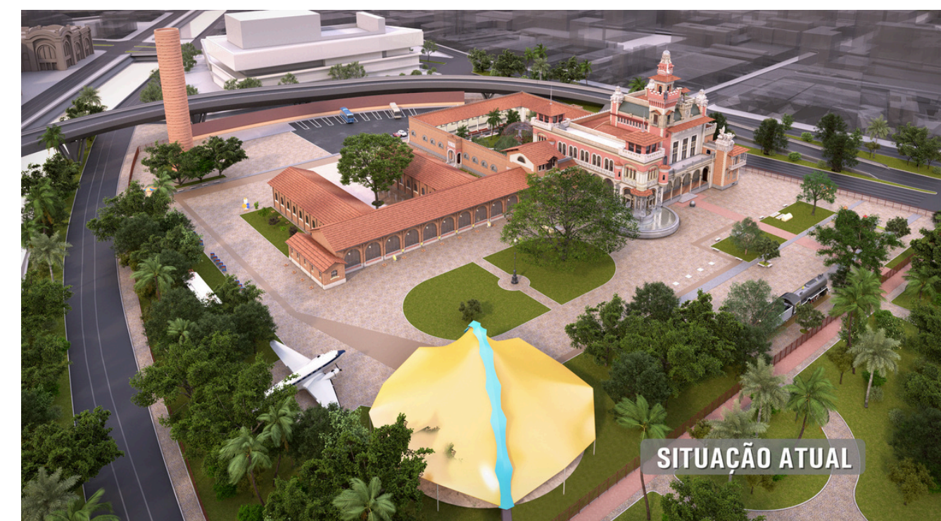
Perspectiva atual do Museu Catavento

Essa ampliação possibilitará o estabelecimento de um fluxo mais lógico e organizado para a visitação, proporcionando melhores condições aos visitantes. Entre as melhorias previstas, destaca-se o reposicionando da lanchonete e da loja do museu próximo à saída e ao estacionamento.