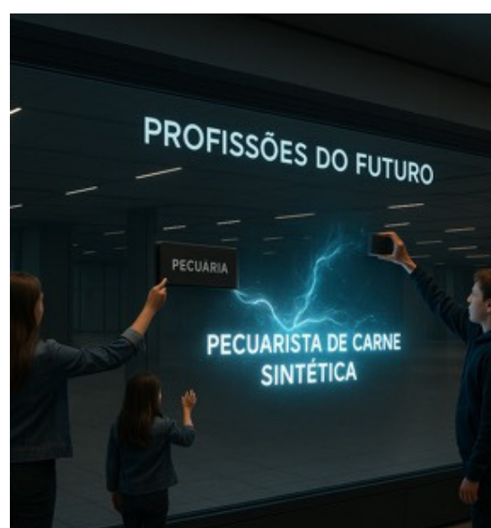
Profissões do Futuro